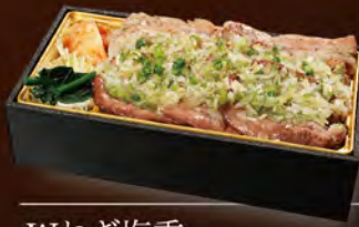
Wねぎ塩重 1,500円 (税込1,620円) (牛タン × 庄内豚)