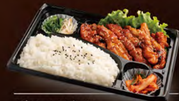
鶏セセリ弁当 780円 (税込842円)