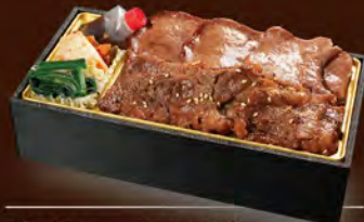
牛タン・カルビ重 1,500円 (税込1,620円)