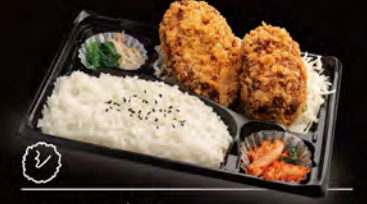
メンチ弁当 (がぶりメンチ × がぶチー) 750円 (税込810円)