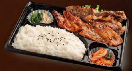
焼肉三種弁当 1,180円 (税込1,274円) ・べろきんカルビ ・庄内豚カルビ ・鶏セセリ