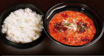
カルビクッパ 880円 (税込950円)