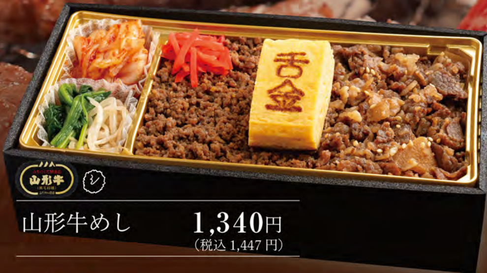
山形牛めし 1,340円 (税込1,447円)