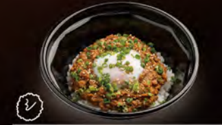
肉屋の和風キーマ 1,000円 (税込1,080円)