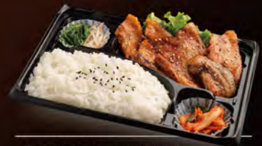
庄内豚カルビ弁当 880円 (税込950円)